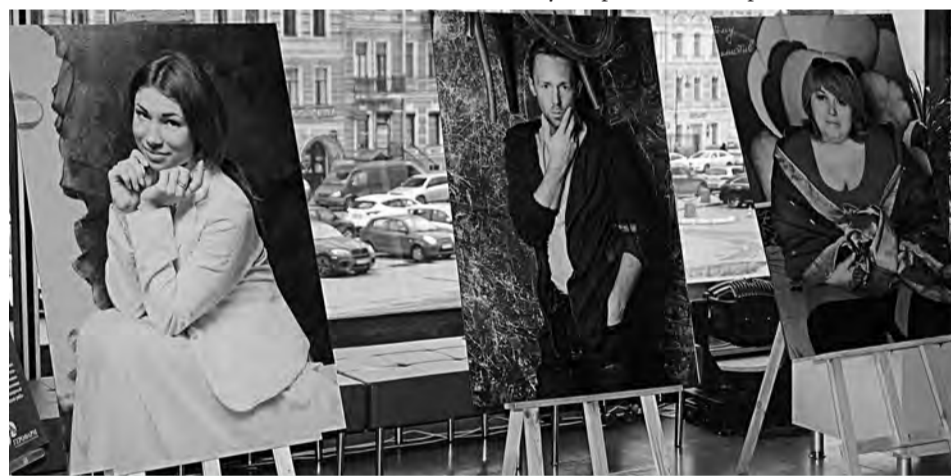
Выставка «Диабет в лицах» была организована в БКЗ «Октябрьский» при содействии Санкт-Петербургского диабетического общества

Своеобразным продолжением истории стал международный фотоконкурс «Диабет: кадры моей активной жизни». Этот конкурс стал еще одним шагом на пути преодоления предвзятого отноше-