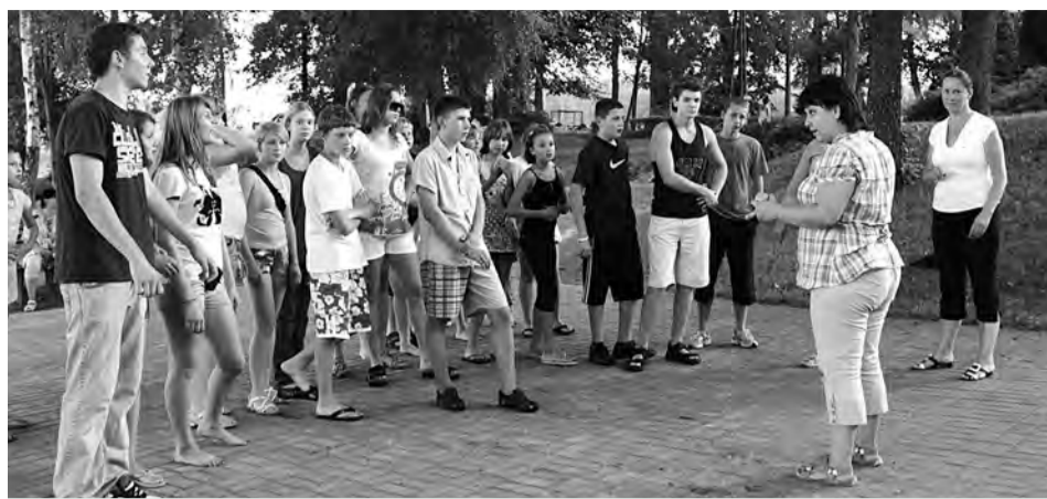
Московская областная общественная организация родителей детей-инвалидов с диабетом и инвалидов с детства «Вера»

Однако организация лагерей отдыха для подростков и молодежи – дело очень даже не простое, требующее особого внимания. Заинтересовать современную молодежь бывает очень сложно. Но сложно – не значит невозможно. Учитывая интересное географическое положение Калининградской области, мы стали организовывать подобные лагеря в Польше. Иногда это были даже международные лагеря с участием польской молодежи и подростков с диабетом. Общаясь со сверстниками, наши дети учатся быть